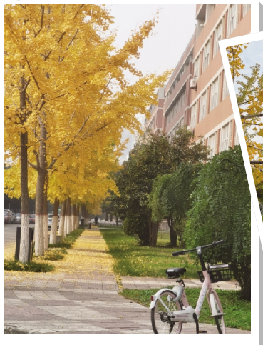
校医院 许小玲 / 摄