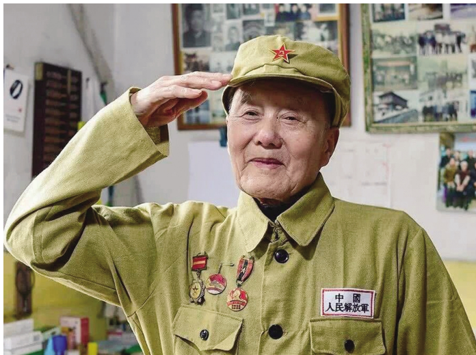
“共和国勋章”获得者张富清

我们当代青年就如巨浪，在这片时代的汪洋大海中要奋力前行，也要如习总书记所说的“老黄牛”一样，吃苦耐劳，艰苦奋斗。作